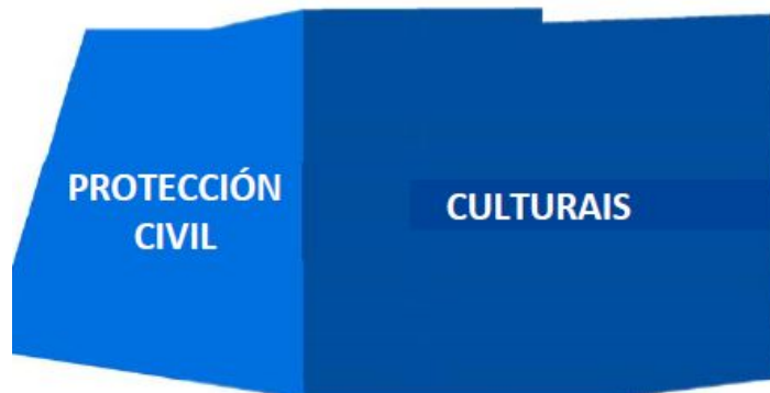
DISTRIBUCIÓN DE USOS